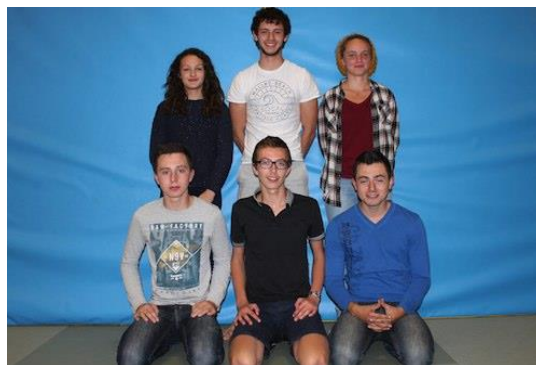
Les Commissaires sportifs